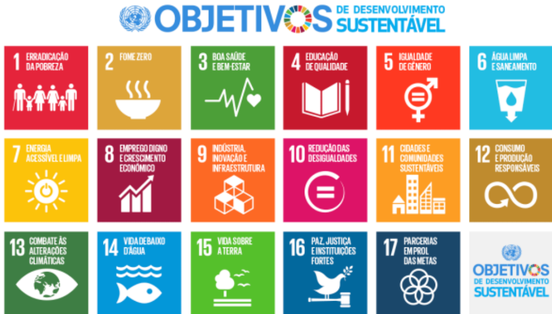
Figura 1: Objetivos de Desenvolvimento Sustentável (ODS)